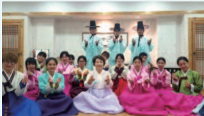
韩语进修-文化体验