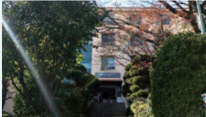
外国人留学生宿舍